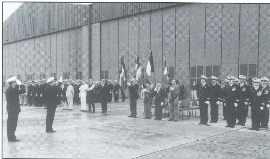
Creil, cérémonie de changement de Commandant de l'escadron "Vercors".