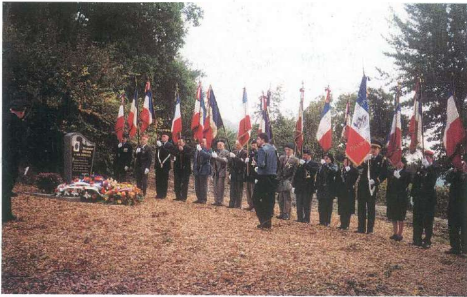
Damery, 19 octobre 2001