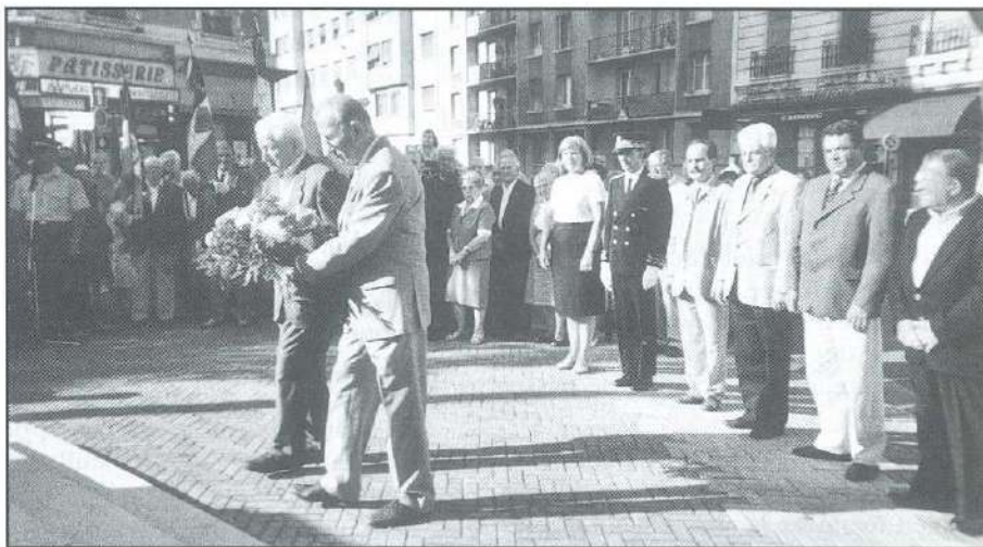
Dépôt de gerbes par le Président Ravix de Villard de Lans

Après l'appel des morts par deux Pionniers, de nombreuses gerbes furent déposées et une minute de silence terminait cette manifestation.