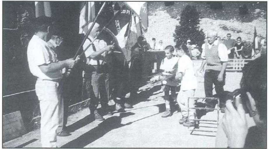
Pas d'Aiguille, 22 Juillet 2001, dépôt de gerbe par petits-enfants de pionniers

A Mens, sous le contrôle du mouvement, Armée Secrète, s'était consti-