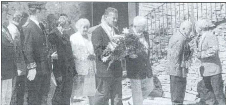
Accompagné par des familles des martyrs, Monsieur le Maire va déposer la gerbe de la municipalité

C'est devant une nombreuse assistance que se sont déroulées les cérémonies anniversaires de l'odieuse tragédie du 25 juillet 1944. La cour des fusillés était bien petite pour contenir tout ce monde qui n'oublie pas, comme l'a rappelé Monsieur le Maire dans son discours écouté dans un profond silence.