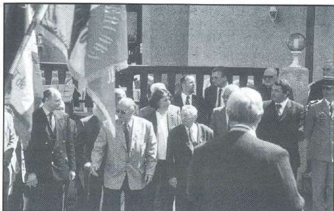
Congrès à Méaudre 2001

C'est à Méaudre, le 12 Mai dernier, que s'est déroulé le congrès annuel des Pionniers et combattants volontaires du Vercors organisé une fois encore par la section d'Autrans-Méaudre.