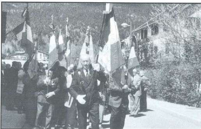
Congrès à Méaudre 2001

De nombreux représentants d'associations amies sont présents également avec leur drapeau.