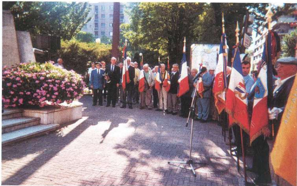
Cours Berriat, Grenoble, devant la stèle des fusillés, 14 avril 2001