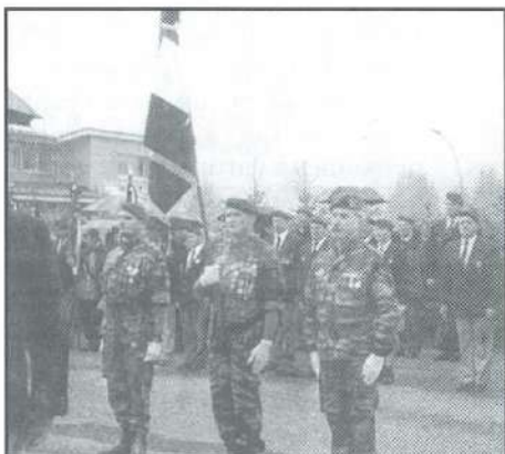
Le drapeau et sa garde

Ce fut une fête un peu mouillée pour ce baptême du nouveau drapeau de l'association des parachutistes de la section Isère de L'U.N.P. le dimanche 23 septembre.