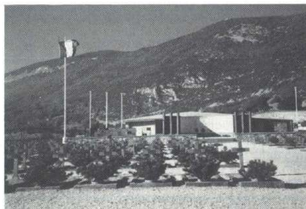
La Salle du Souvenir. Nécropole de Vassieux-en-Vercors.