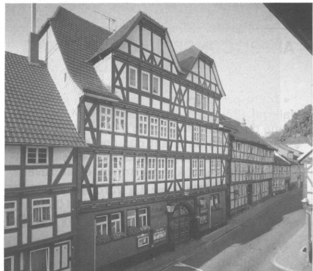
L'imposante façade à colombages de l'auberge « ZUR KRONE » (1605), ruelle du Marché, sur le « KESPERMARKT » (Marché aux cerises) de WITZENHAUSEN.