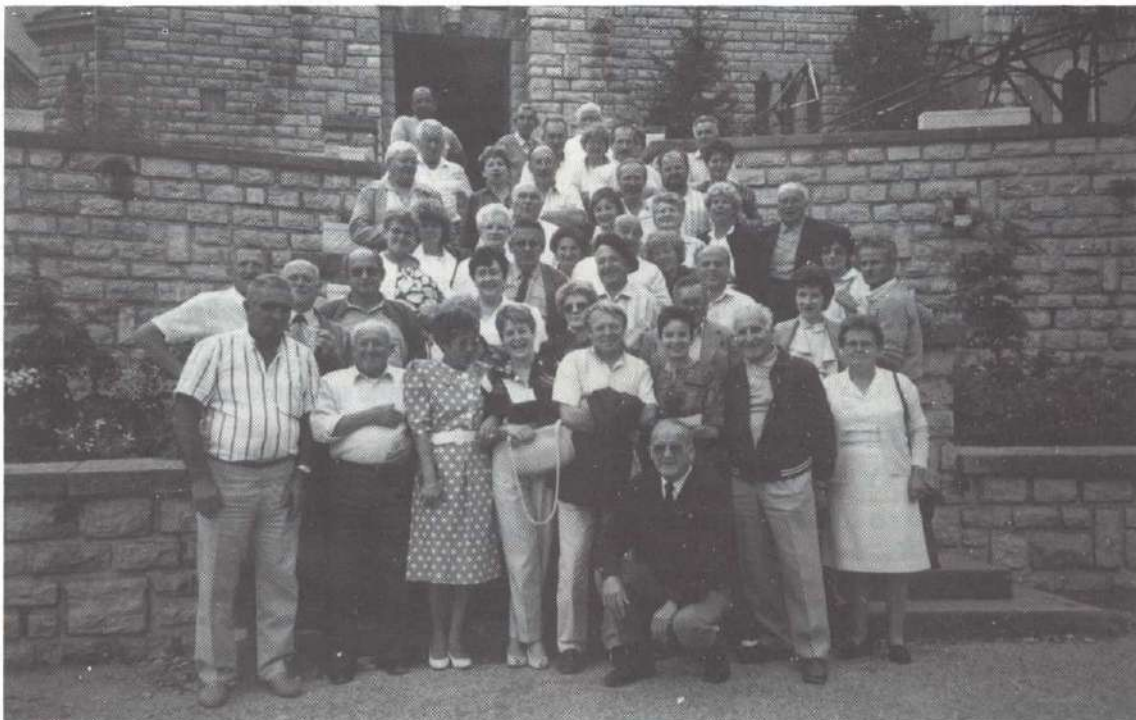
Le groupe de Saint-Cergues devant l'église de Vassieux.