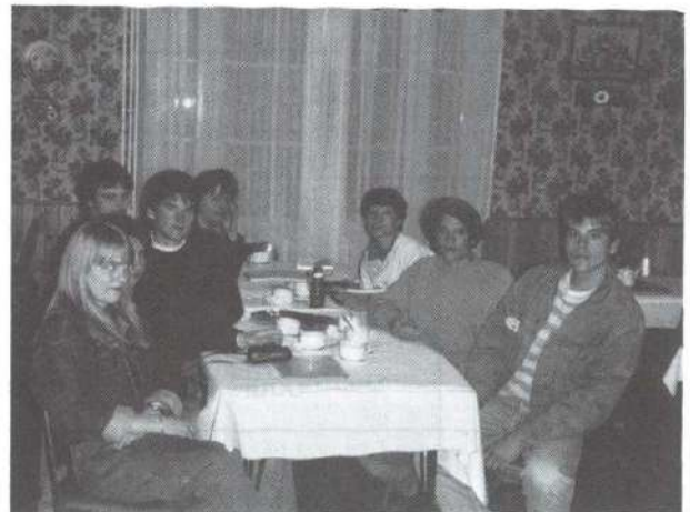
Le groupe de jeunes Allemands du lycée de Witzenhau- sen, en visite à Vassieux, le 15 octobre 1989.

Nous nous excusons auprès de tous nos amis pour ces restrictions dues aux circonstances.